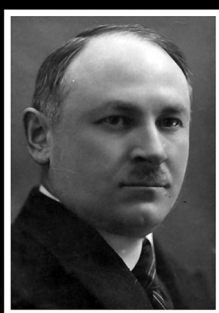
ד"ר ליאון רייך, ציוני ופעיל פוליטי בולט מדרוהוביץ'