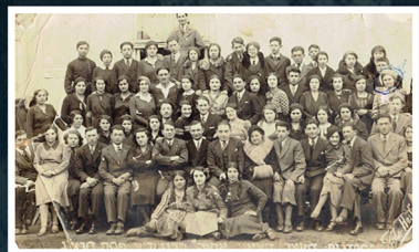
תנועת הנוער הציוני, אחוה, דרוהוביץ', 1933.