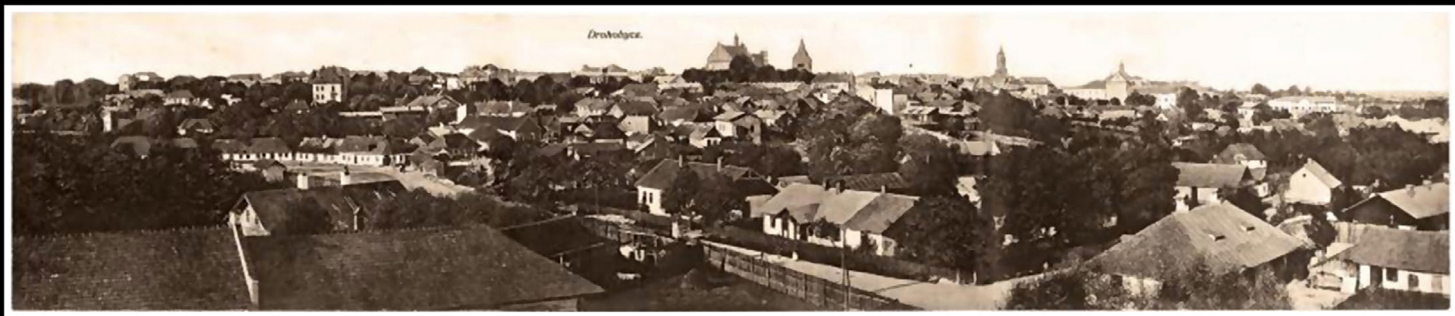
Drohobycz panorama, circa 1915