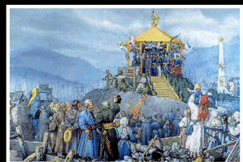
"הקיסר מבקר בשדות הנפט בבוריסלב", ויצי'ק גרבאוסקי