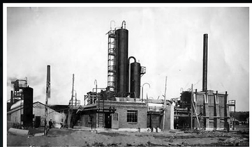
בתי הזיקוק "גליציה" נבנו בדרוהוביץ' ב-1863