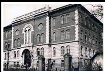
בית היתומים היהודי, דרוהוביץ'

גילוי שדות הנפט והגז במאה ה-19 באזור בוריסלב ודרוהוביץ' שינה את פניהן ואת גורל תושביהן. ההזדמנויות הכלכליות שנוצרו משכו אנשים, חברות בין-לאומיות וממון רב. בוריסלב, מרכז הפקת הנפט והשעווה, גדלה במהירות רבה. דרוהוביץ' נעשתה למרכז עירוני משגשג ומרכז התעשייה המתפתחת. למרות היותה עיר קטנה יחסית דורגה דרוהוביץ' בשנות ה-70 כעיר השלישית בעושרה בגליציה. ההגבלות שהוטלו על היהודים במאה הקודמת הוסרו בתקופת הקיסר האוסטרי פרנץ יוזף. הם נהנו עתה מזכויות אזרחיות שוות והשתלבו בחיי החברה והכלכלה של האזור. גם חיי הקהילה היהודיים פרחו, ונבנו מוסדות קהילה מתקדמים. בדרוהוביץ' נבנו בית הכנסת הגדול, בית ספר חילוני, בית יתומים ובית חולים יהודי.