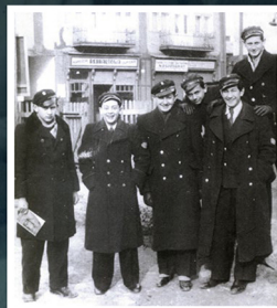
תלמידי הגימנסיה בבוריסלב, 1938

דרוהוביץ' ובוריסלב לא היו עיירות שטייטל גליצאיות טיפוסיות. הקהילות האמידות התפתחו באורח מודרני. רבים מן היהודים, עניים ועשירים, עסקו בתעשיית הנפט ובשירותים הנלווים. גם אלה וגם אלה נהנו ממרחב רב-תרבותי וכלכלי עשיר ומן ההזדמנויות הייחודיות שנתהוו עם זרימתם של אנשי מקצוע ובעלי השכלה גבוהה זרים לאזור. ארגוני ספורט יהודיים ותנועות ציוניות פרחו וכך גם תיאטרון יידי ופעילות מוזיקלית. עיתונים אחדים בשפת היידיש ובפולנית יצאו לאור. הדרוהוביץ' צייטונג דיווח החל משנת 1883 בגרמנית באותיות עבריות על חדשות מקומיות ונושאי תעשיית הנפט. בשתי הערים נטלו יהודים חלק פעיל ורם במפלגות ובמועצות המקומיות. חיים פורחים אלה נגדעו עם פרוץ מלחמת העולם השנייה.