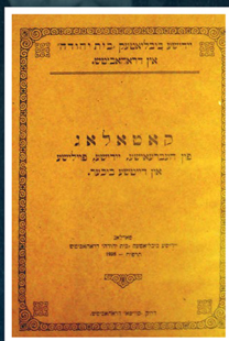
קטלוג ספרים בעברית, בידיש, פולנית וגרמנית, ספריית "הבית היהודי", דרוהוביץ, 1928