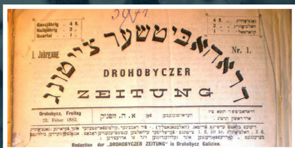
העיתון דרוהוביץ' צייטונג, 1883–1914