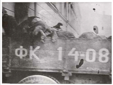
דרוהוביץ', גופות יהודים מורחקות במשאיות