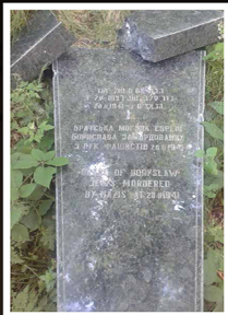
מצבה לקורבנות "אקציית הנכים" שהושחתה, יער ליד טוסטנוביצה

Memorial at the mass graves in the forest of Bronica – Jews are not mentioned as victims