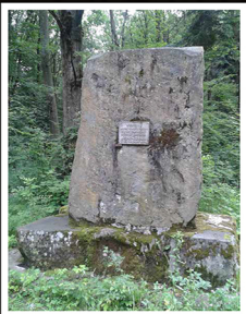
מצבה ליד קברות האחים ביער ברוניצה. קורבנות יהודים אינם מוזכרים

The systematic mass murder of Jews in Drohobycz, Boryslaw and vicinity started in November 1941. In Drohobycz, the Judenrat (Jewish Council) was ordered to compile a list of 350-400 unemployed Jews who were summoned to the Employment Office on November 22. About 250 adults and an unknown number of children appeared. They were driven in trucks to the Bronica Forest and shot by a firing squad. Five days later Nazi forces carried out a similar “Aktion” in Boryslaw, murdering 700 in the woods outside of town. From this point forward, throughout the entire Nazi occupation, Aktionen were conducted periodically. An Aktion conducted in March, 1942 culminated in the first deportation of Drohobycz Jews to the Belzec extermination camp.